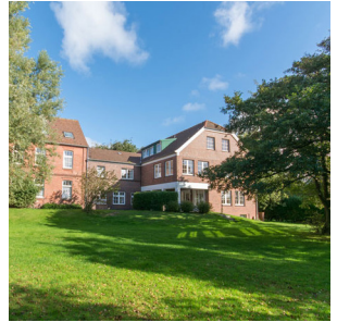
Haus Barmen Spiekeroog