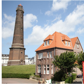
Haus Blinkfüer Borkum