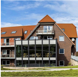
Gästehaus Sonnenhütte Baltrum