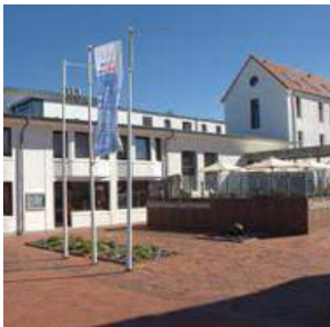
Gästehaus Germania Wangerooe