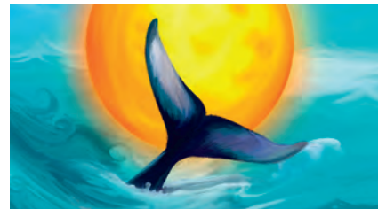
Loslassen und neu anfangen wie „Jona und der Wal“.