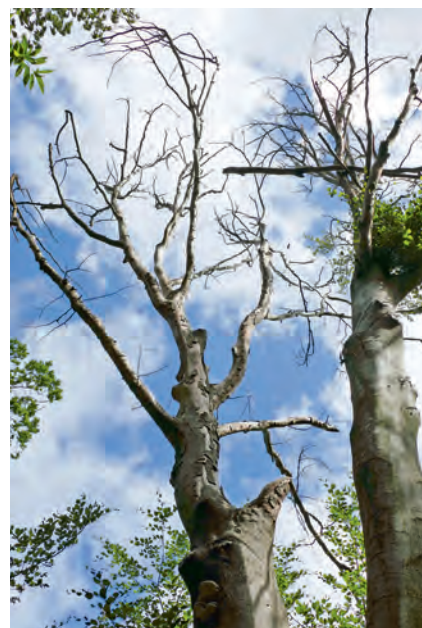
Kahle Bäume im Wald.

ment „Pflanzen im Klimawandel“ realistisch abläuft, werden die Bäume im Garten nicht oder kaum gegossen. Denn letztendlich könne man gegen die Dürre in den Wäldern direkt auch nichts unternehmen. Ortswechsel: Nach dem Gartenrundgang schauen wir uns den traurigen Ist-Zustand eines nahe gelegenen Waldes an. Jetzt bekomme ich direkt zu sehen, wie geschädigt die Bäume sind. Eigentlich müssten die Buchen -und Eichenwälder zu dieser Jahreszeit ein dichtes Blätterdach haben und Spaziergänger:innen Schatten spenden. Aber so ist