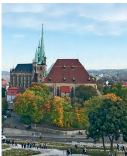
Im Erfurter Dom wurde 1236 die Heiligensprechung Elisabeths feierlich bekannt gemacht.