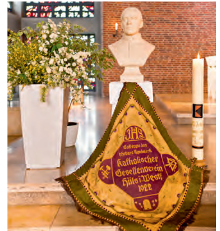
Das wertvolle Banner aus dem Jahr 1922 konnte vor den Kriegswirren gerettet werden.

Die Gründung des Hülser Gesellenvereins erfolgte am 29. Januar 1922, damit 14 Jahre bevor Marl seine Stadtrechte erhielt. Ziel war die praktische Umsetzung der Lebensphilosophie Adolph Kolpings als katholischer Sozialverband. Während der NS-Zeit wurde der Verein verboten und kam somit zum Erliegen. Nach dem II. Weltkrieg und dem Ende des NS-Regimes gab es am 21.