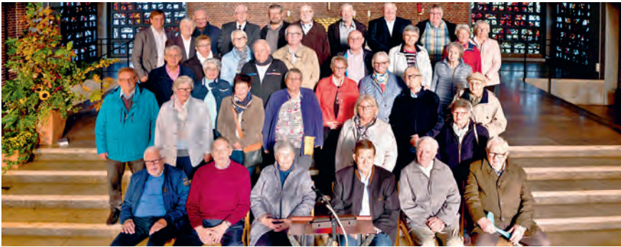
Die Kolpingsfamilie Marl-Hüls im Jubiläumsjahr.