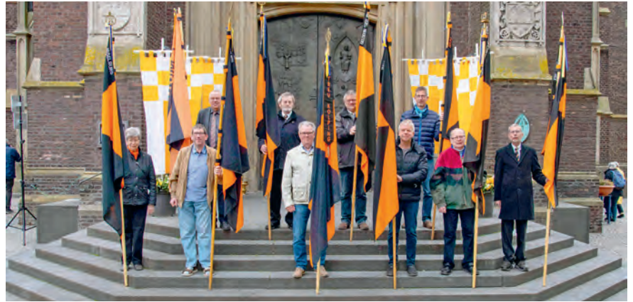
Einige Kolpingbanner-Träger_innen stellten sich zu einem Erinnerungsfoto vor der Kevelaerer Basilika auf.

„Nach dem Festhochamt zogen wir zum Gnadenbild, wo gemeinsam mit dem Bischof das Kolpinggebet