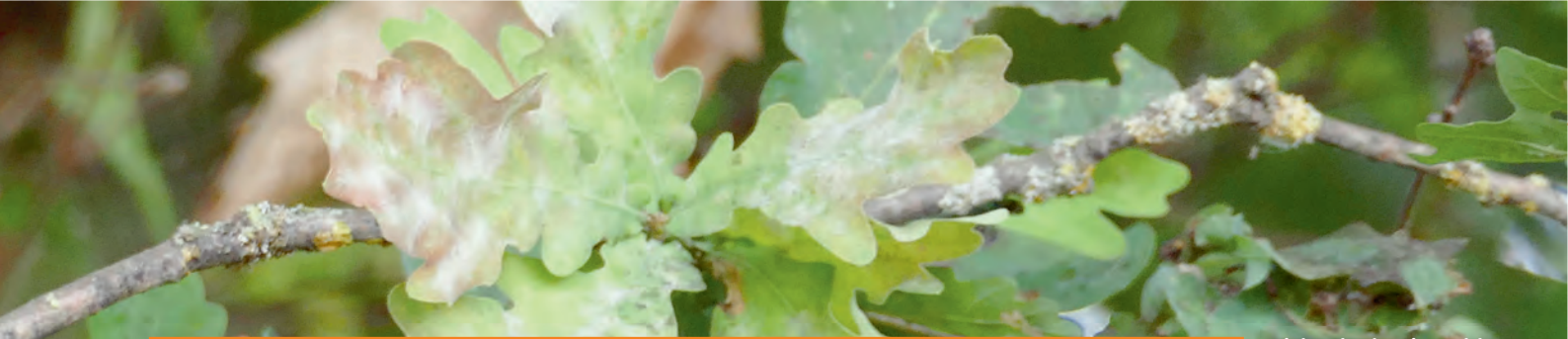
Eichenlaub mit Mehltau